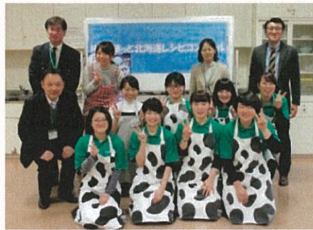
レシピコンクールに参加した学生たち

これを受け、北海道栄養士会では、北海道在住の公認スポーツ栄養士6名で冬季アジア札幌大会栄養サポート委員会（冬季アジア栄養サポート委員会）を立ち上げ、「HÖT（ほっと）ネットワーク～広げよう世界へつなげよう未来へ」（HÖT：競技力発揮のため、ほっと：安全の確保・心を込めて）をフードレガシー 1 として、各ホテルの食事に関する支援業務と併せて、フードレガシーを開催地域で活用していく方法も、第8回札幌アジア大会冬季競技大会組織委員会と一丸となり検討していきました。