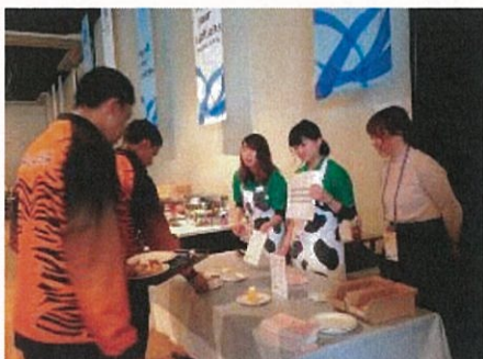
大会参加選手への提供

調理審査は、札幌市食育推進会議会長や公認スポーツ栄養士、調理師など専門家に依頼するとともに、調理審査前日には、入賞レシピをイベント会場に展示して、来場された市民による投票も行いました。