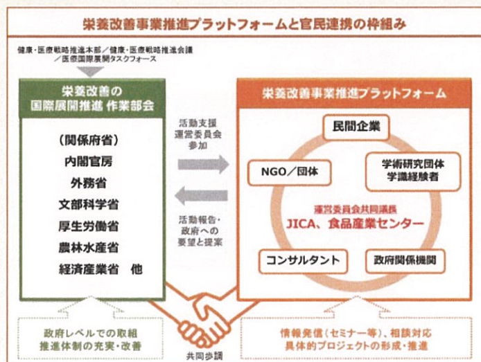
図表1 「栄養改善事業推進プラットフォーム」と官民連携の枠組み

このように「栄養改善事業推進プラットフォーム」は、官民連携の枠組み（【図表1】参照）の中で国際的な栄養改善事業を推進していくことで、途上国への支援の役割を果たすとともに、日本の経済成長にも寄与し、世界の栄養改善に継続的に貢献していきます。