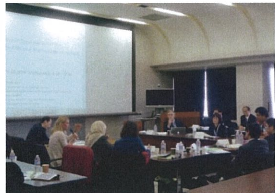
第7回アジア栄養ネットワークシンポジウムにおける基調講演と総合討論