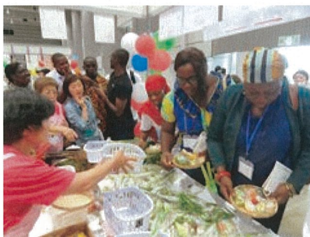
「第11回食育推進全国大会inふくしま」でのブース見学

独立行政法人国際協力機構（JICA）では、日本の「食育」の取組をガーナの栄養改善に役立てるための短期研修を平成26（2014年）から毎年、実施しています。平成28（2016）年6月に実施したガーナ国別研修「栄養政策実践のためのマルチセクターアプローチ」では、我が国の食育の背景、第3次基本計画、食育ガイドや、学校給食、民間連携なども紹介しました。さらに、ガーナの研修員は「第11回食育推進全国大会inふくしま」（郡山市）の会場を訪れ、産学官が出展する様々なブースを見学し、食育を体験しました。